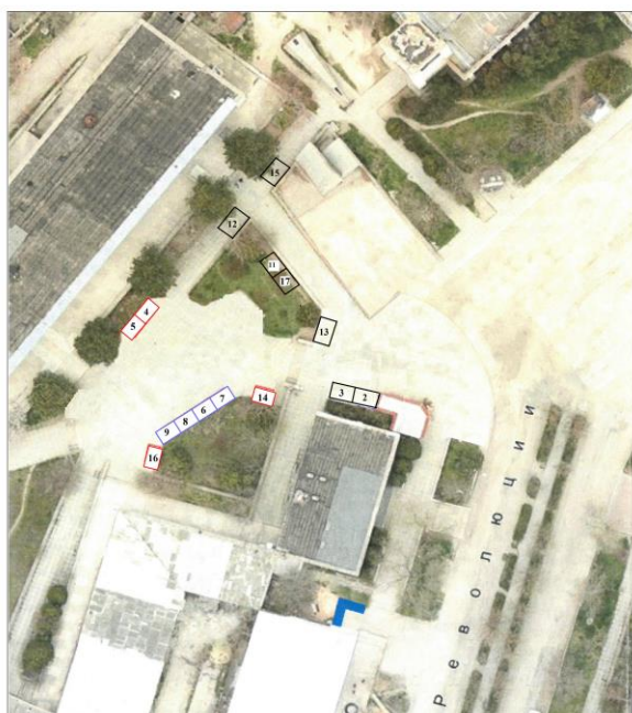
Схема размещения торговых мест на продовольственной розничной ярмарке на территории Черноморского сельского поселения