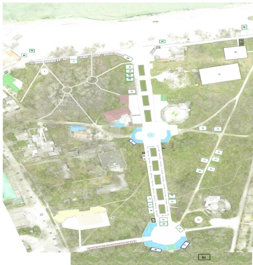
Схема размещения торговых мест на универсальной ярмарке на территории Черноморского сельского поселения Черноморского района Республики Крым